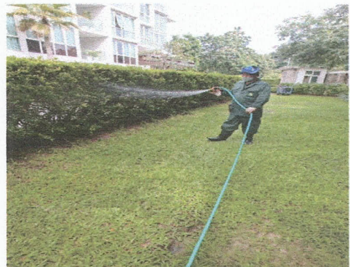
ภาพที่ 1-2 การปลูกต้นไม้ภายใน และภายนอก โครงการ NORTH PARK PLACE

และ การดูแลต้นไม้ให้มีความร่มรื่นทั้งโครงการ