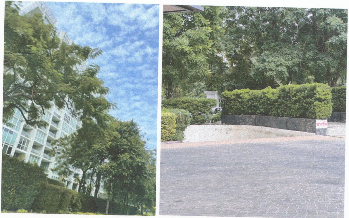
ภาพที่ 1 - 3 สภาพอาคารและสิ่งแวดล้อมด้านหน้า และด้านหลัง โครงการ NORTH PARK PLACE (ถ่ายวันที่ 4 พฤศจิกายน 2568)

ปัจจุบันของโครงการอยู่ในช่วงเปิดดำเนินการ โครงการมีสภาพสิ่งแวดล้อมที่ดี การคมนาคมสะดวก ภายในโครงการมีการปลูกและบำรุงต้นไม้ขนาดเล็ก และต้นไม้ทรงสูงโดยรอบทั้งโครงการ